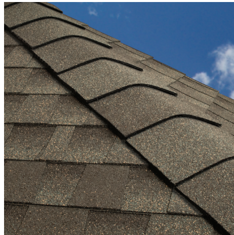
Après Finition distincte qui protège également contre les fuites et l'arrachement par le vent des bardeaux.