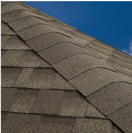
Avant Bardeaux coupés à 3 pattes utilisés aux arêtiers et aux faîtières.